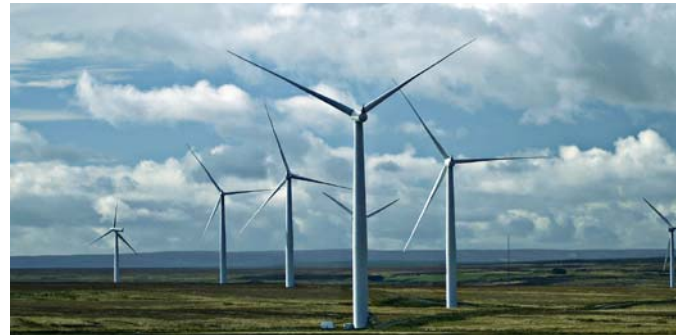
Les énergies renouvelables constituent une option de réduction des émissions de gaz à effet de serre

Les mesures d'atténuation peuvent également présenter d'autres avantages pour la société, comme les économies en termes de coûts de soins de santé découlant d'une réduction de la pollution de l'air. Cependant, prendre des mesures d'atténuation dans un pays ou groupe de pays pourrait augmenter les émissions ailleurs ou influencer sur l'économie mondiale.