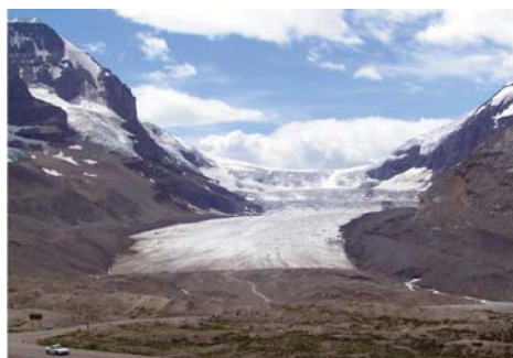
De nombreux glaciers à travers le monde sont en train de fondre

Le changement climatique à l'échelle régionale affecte déjà de nombreux systèmes naturels. Par exemple, on observe de plus en plus que la neige et la glace fondent et que le sol gelé dégèle. De plus, on note que les processus liés au cycle de l'eau et les systèmes biologiques changent et sont parfois perturbés, que les migrations débutent plus tôt que par le passé et que les aires de répartition géographique de certaines espèces se déplacent vers les pôles.