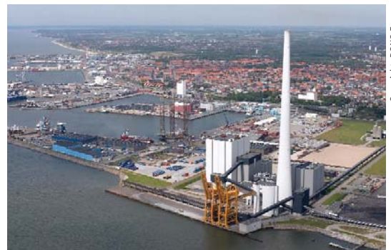
Centrale électrique d'Esbjerg, au Danemark, où un système de piégeage du dioxyde de carbone est en place

S'orienter vers des voies de développement plus durables peut largement contribuer à atténuer le changement climatique. Les politiques qui contribuent à la fois à l'atténuation du changement climatique et au développement durable comptent notamment celles liées à l'efficacité énergétique, aux énergies