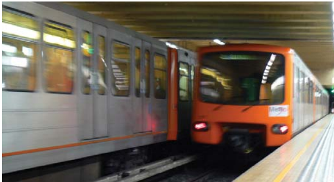
Les transports publics peuvent contribuer à réduire les émissions de gaz à effet de serre

Des changements dans le mode de vie et les comportements qui favorisent la préservation des ressources naturelles peuvent contribuer à atténuer le changement climatique.