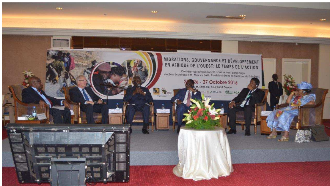
Une vue des hôtes de marque et intervenants lors de la cérémonie d'ouverture.

A l'issue de cette cérémonie d'ouverture, les participants ont pu se focaliser sur le premier panel portant sur les réalités et les tendances migratoires en Afrique de l'Ouest.