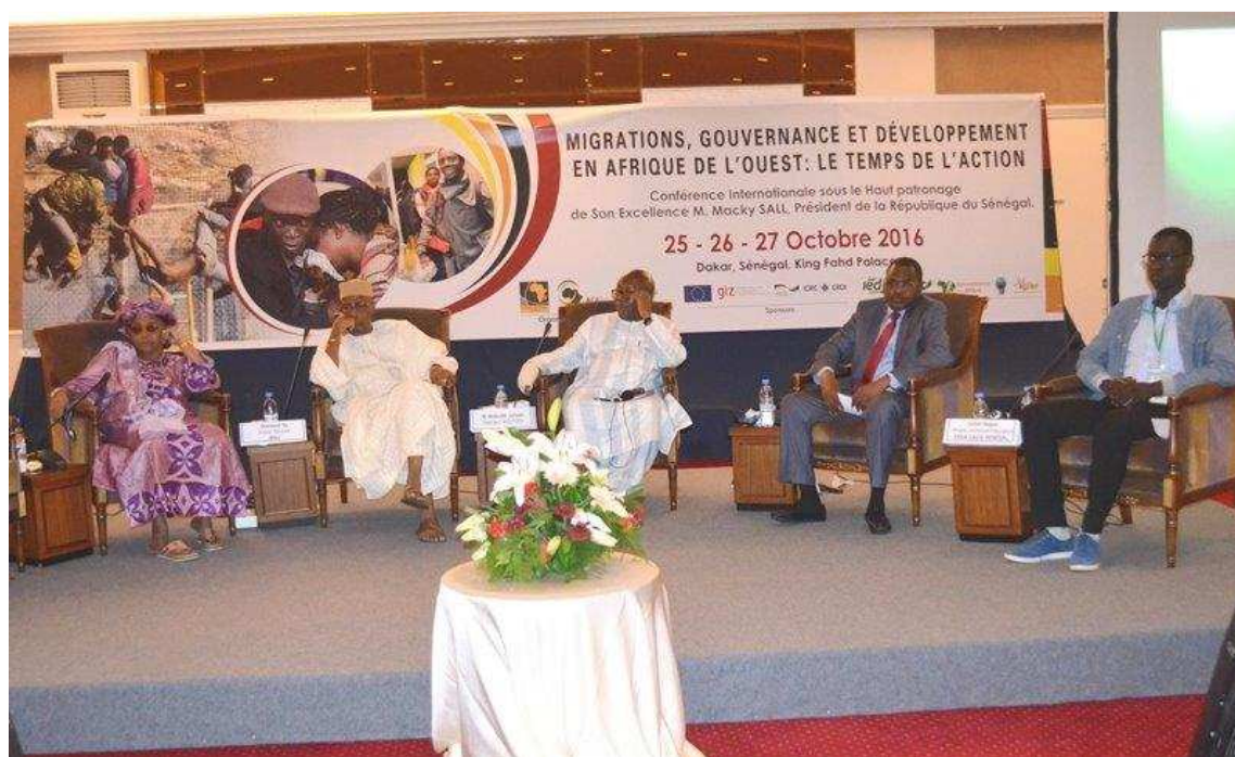
Vue de certains panélistes lors de la cérémonie de clôture.

fournissent une base pour développer un programme d'action qui sera élaboré et inséré dans le rapport de la Conférence. En termes d'initiatives immédiates, M. Janneh a mentionné le partage des résultats de la Conférence avec le reste du monde lors de la prochaine réunion de l'UNECA, de même que l'organisation d'une série de dialogues nationaux sur la gestion des migrations. M. Janneh a insisté sur le fait que la conférence ayant révélé davantage l'importance des migrations pour l'Afrique de l'ouest, il est nécessaire qu'elles ne deviennent pas un problème, mais que chaque pays en fasse un pilier de développement, en cohérence avec la vision de la CEDEAO.