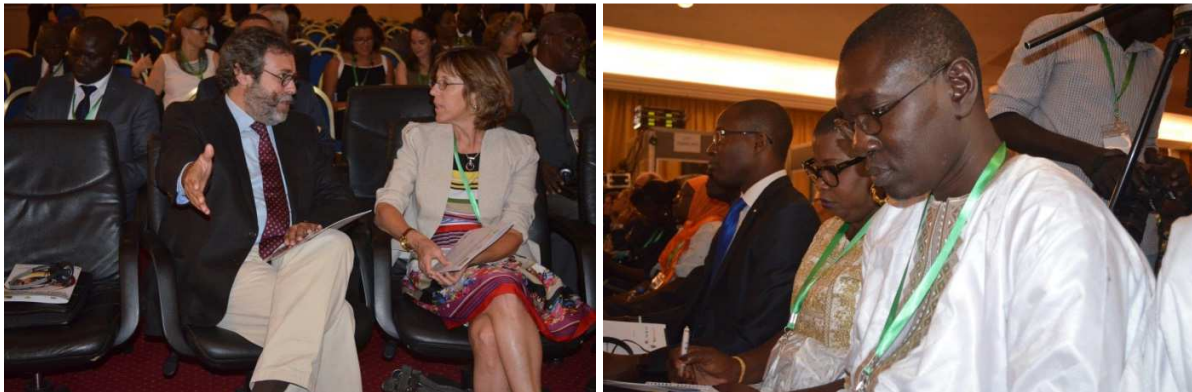
Une vue des participants durant les travaux