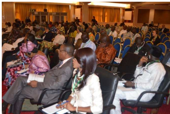
Une vue des participants durant les travaux