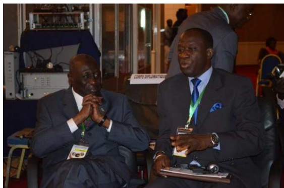
Echanges entre participants durant les travaux